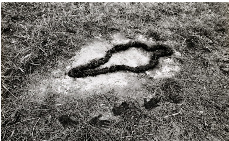
Ana Mendieta - Untitled: Silueta Series - 1978

11. Il corpo vulnerabile / malattia e morte: Vanessa Beecroft, Sam Taylor-Wood, Andres Serrano