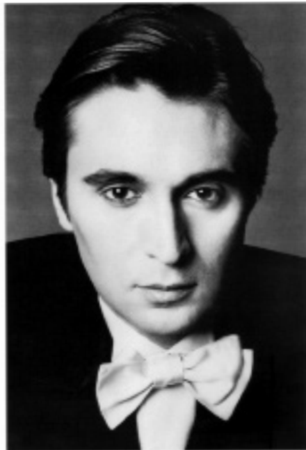
Francesco Vezzoli, FRANCESCO BY FRANCESCO: BEFORE & AFTER. with love - 2002