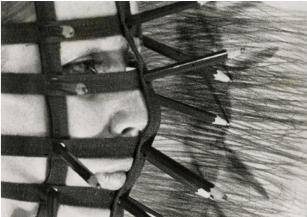
Rebecca Horn - Pencil Mask - 1972

Si richiede la realizzazione di un progetto personale concordato e una verifica teorica che farà parte della discussione del progetto finale. Parte del progetto può anche essere eseguito in spazi personali ma discusso nel suo procedere nelle ore di laboratorio